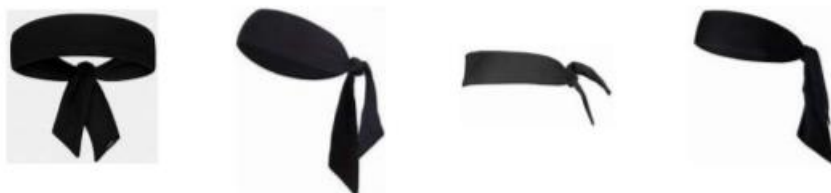
Figure 1 : Bandeau de tête de type bandana

Le port de bandeau de tête de type bandana (bandeau noué) n'est pas autorisé