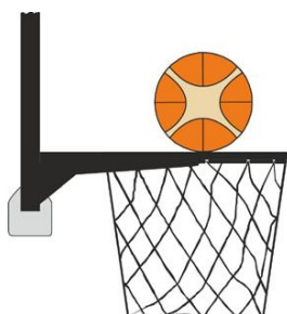
Figure 3 : Ballon en contact avec l'anneau

Une intervention illégale est commise par un joueur défenseur ou attaquant si, lors d'un tir au panier, un joueur touche le panier (l'anneau ou le filet) ou le panneau alors que le ballon est en contact avec l'anneau et qu'il a encore une chance de pénétrer dans le panier.