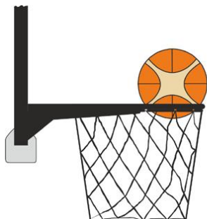
Figure 4 : Ballon à l'intérieur du panier

Il y a violation pour intervention illégale si un joueur défenseur touche le ballon quand il est à l'intérieur du panier.